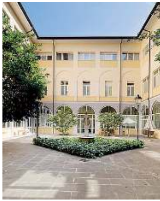
Fondazione Casa di Dio. Il nuovo sportello apre il 9 giugno

■ La persona che si trova nell'impossibilità, anche parziale o temporanea, di provvedere ai propri interessi e al proprio benessere, può essere assistita da un Amministratore di sostegno nominato dal Giudice tutelare del luogo in cui questa ha la residenza o il domicilio; ma sono molte altre le misure di tutela che la protezione giuridica regolamenta. L'Ufficio di Protezione giuridica di Ats Brescia