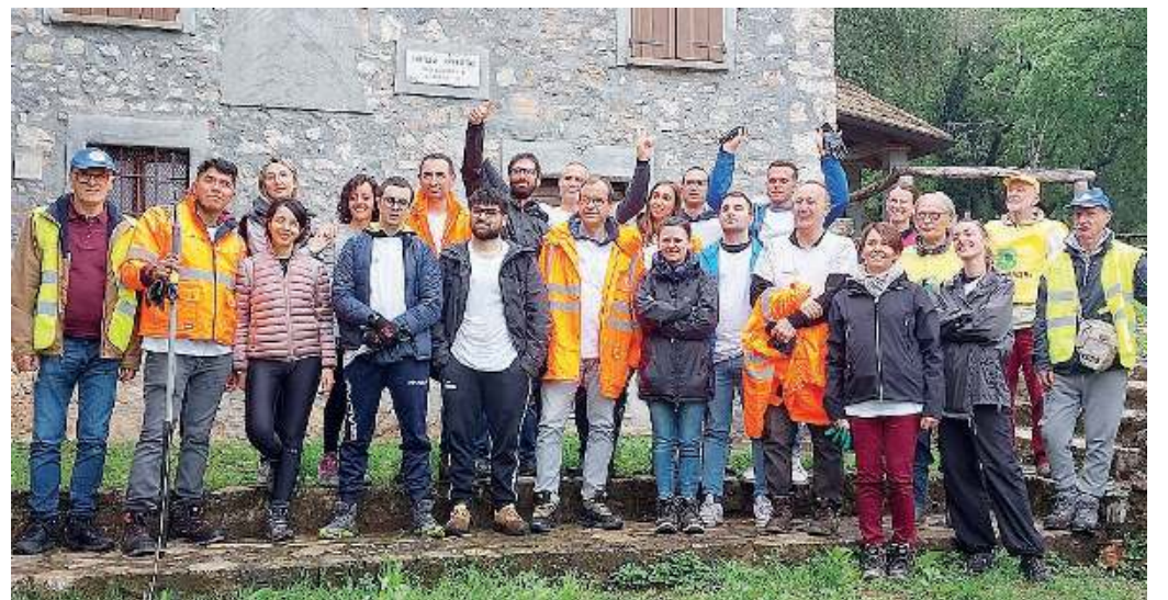
Tutti insieme. I volontari impegnati a Concesio provenivano da esperienze diverse fra loro

del patrimonio culturale e paesaggistico e promuovono eventi culturali per la diffusione della cultura del volontariato. L'associazione promuove il sostegno a distanza e realizza progetti di cooperazione internazionale. Presso la Casa della Pace (in Piazza Garibaldi, 11) vengono svolti inoltre servizi di accoglienza alle persone in stato di necessità (doccia, ricambio indumenti, pasti caldi, posto letto). Per maggiori informazioni sulle attività e su come sostenere i progetti 030.2753321 o consultare il sito http://www.sanvigiliosolidale.it